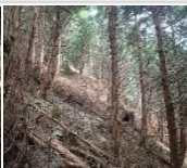
↑ヒノキの状況(②の森)