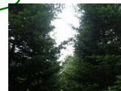
↑トドマツの状況(上部)