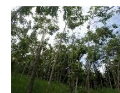
↑ヤマハンノキの群落