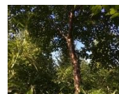
↑エゾヤマザクラの状況