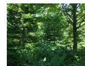
↑アカエゾマツの状況①