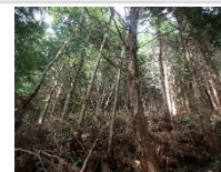
↑ヒノキの状況(①の森)