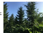
↑アカエゾマツの状況