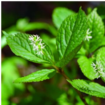
名残のヒトリシズカ