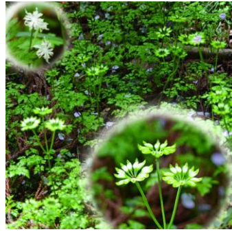
セリバオウレンは種を実らせ