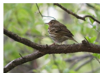
休憩中のビンズイ