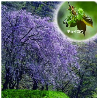
シダレサクラと ちょっと珍しいギョイコウ

コブシもサクラも、咲いたと思ったら、あっという間に散りました。カタクリの花も終わり、ショウジョウバカマは花をつけたまま、ぐんと茎をのびてこられた、あっという間に花が終わりました。駆け足というにはあまりに早い！！疾走する春です。