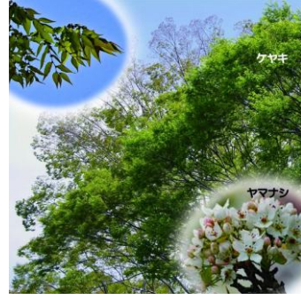
満開のヤマナシとケヤキ