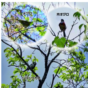
ことりたちのさえずり