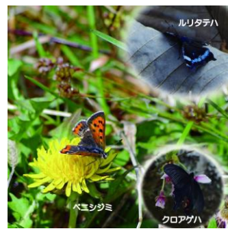
春先のチョウたち