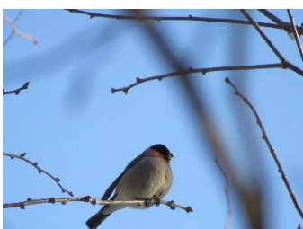
花芽を食べるウソ