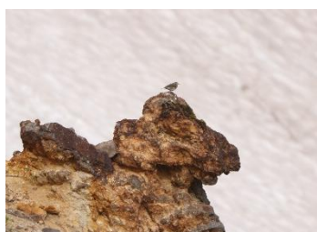
崖の上でさえずるビンズイ