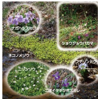
足元には たくさんのスミレの群生