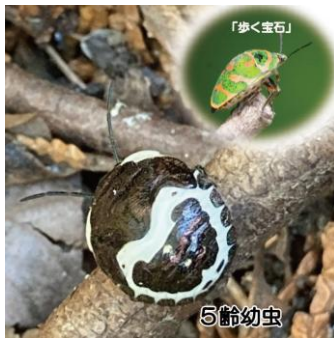
アカスジキンカメシの 5 齢幼虫